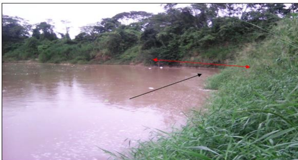
FIGURA N°01: TRAMO CRÍTICO EN EL RÍO SISA, EN EL SECTOR DOS UNIDOS, SOCAVACION DE LAS PAREDES DE TALUD DE RIBERA, GENERANDO DERRUMBES.